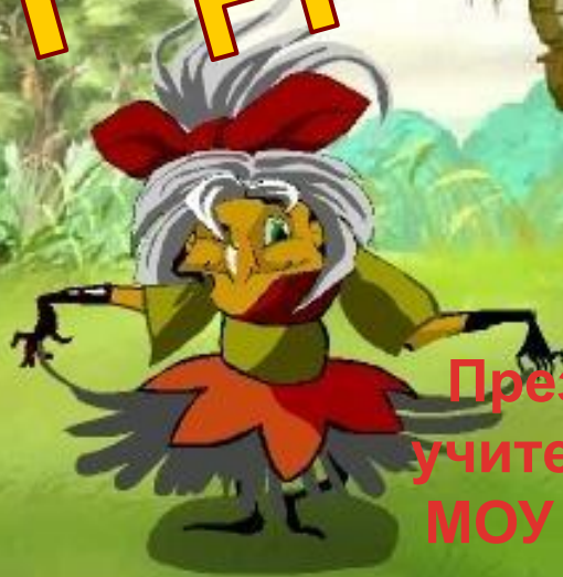
Таблица умножения и деления на

Презентацию выполнила: учитель начальных классов МОУ Кантемировской СОШ №2