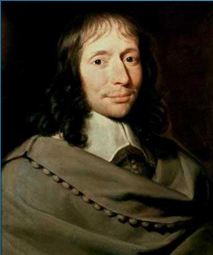
Блез Паскаль французский ученый 19.06.1623- 19.08.1662

Предмет математики настолько серьезен, что полезно не упускать случаев делать его немного занимательным