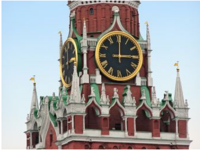
Кремлёвские куранты г. Москва.