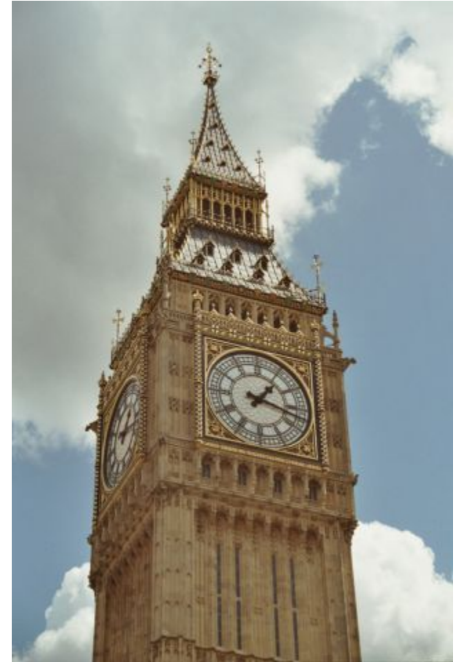
Биг Бен г. Лондон Великобритания