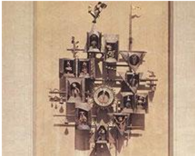
Часы Театра кукол г. Москва.