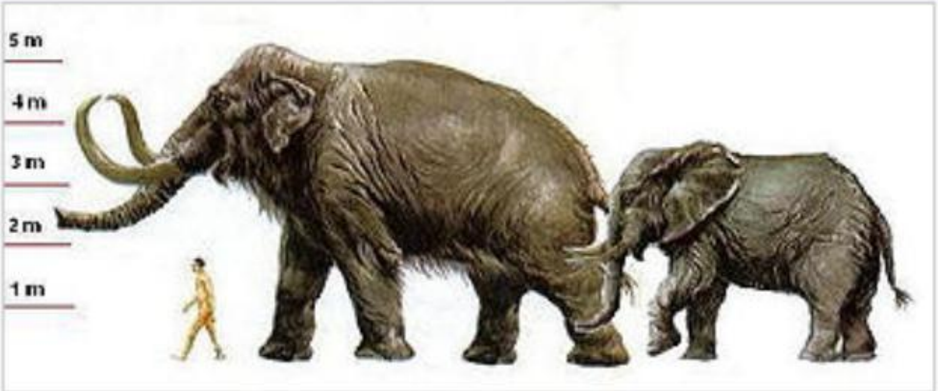
Сравнительные размеры мамонта, современного африканского слона и человека