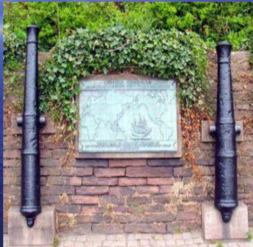
парк Витуса Беринга в датском городе Хорсенс

В 1866 г. Берингу поставлен памятник в Петропавловске.