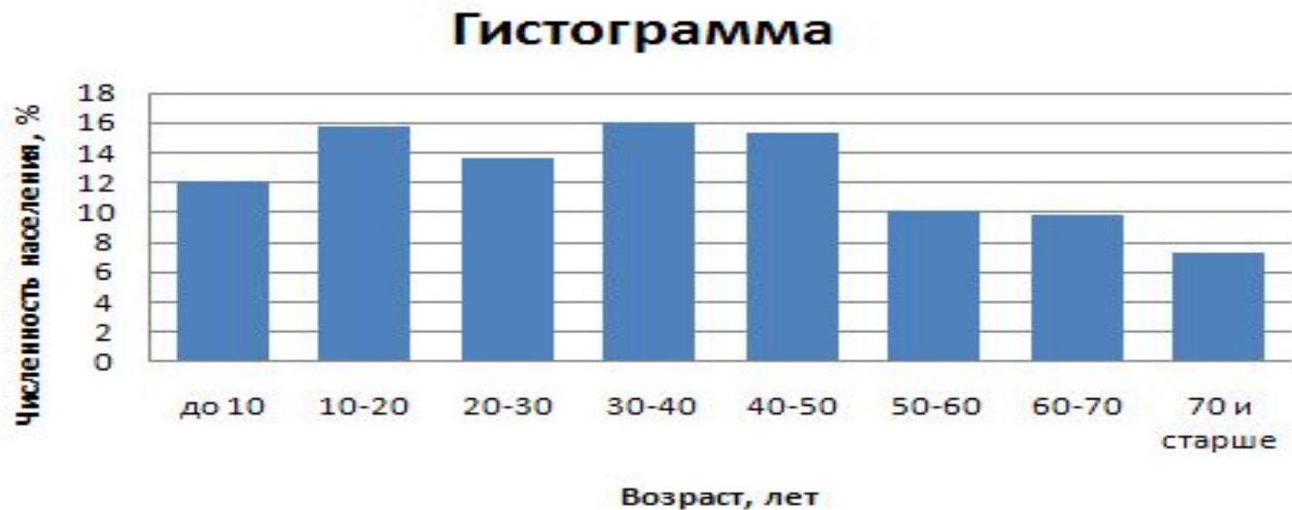
Рис. 6.2. Распределение населения России по возрастным группам