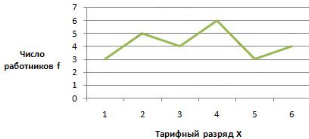
Полигон распределения (рис 1)