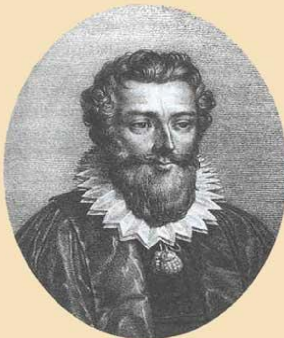
Франсуа Виет. Литография с гравюры XVI в.