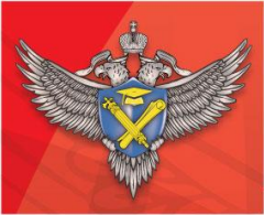
График введения ВПР

ФЕДЕРАЛЬНАЯ СЛУЖБА ПО НАДЗОРУ В СФЕРЕ ОБРАЗОВАНИЯ И НАУКИ