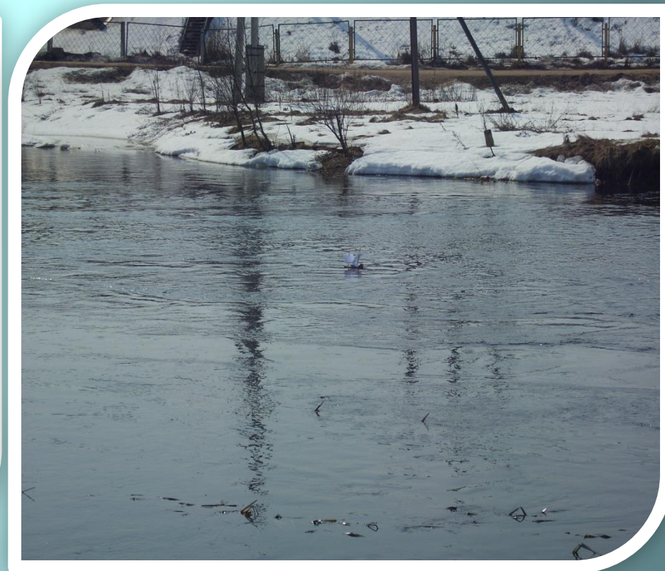
Апрель 2009 г.