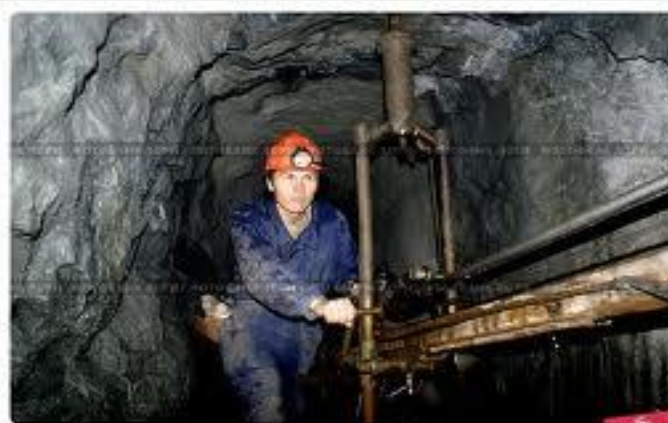
Молодой шахтёр-проходчик за буровой установкой в забое

© Кадр из фильма «Рынок / Фольклор» Дорж