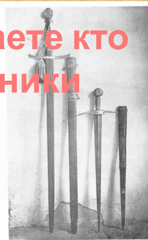
1 2 0 25 см