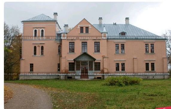
Дом-музей Софьи Ковалевской, деревня Полибино, Псковская область