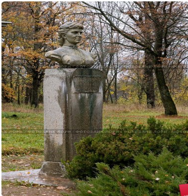
Бюст Софьи Ковалевской, дом-музей, деревня Полибино, Псковская область