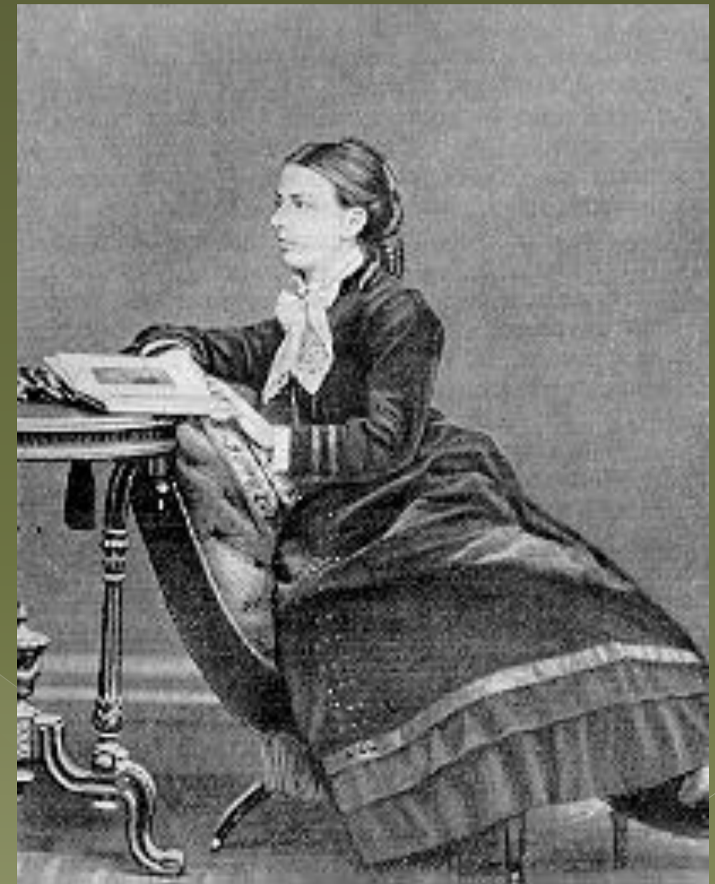
Софья Васильевна Ковалевская

В 1868, чтобы иметь возможность заниматься наукой, вступила в фиктивный брак (ставший позднее фактическим) с В. О. Ковалевским и в 1869 г. уехала в Гейдельберг, где изучала математику.