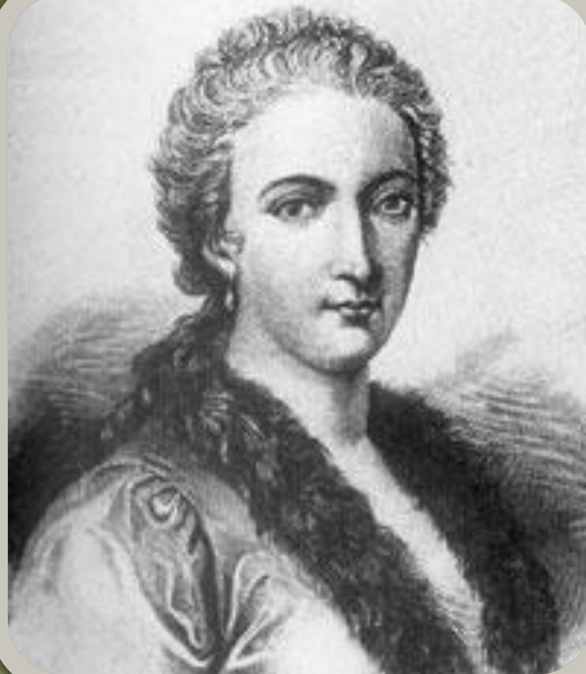
Мария Гаэтано Агнеси