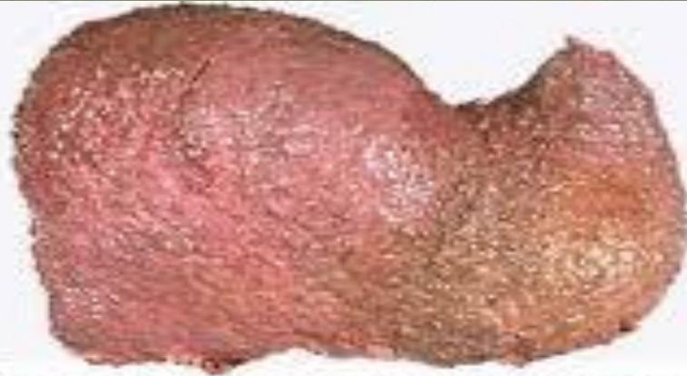
Печень пораженная алкоголем