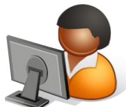
Служба ведения договоров