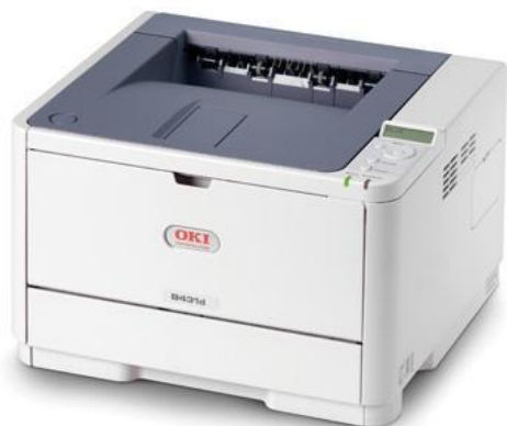
Принтеры OKI моделей B431d или B431dn