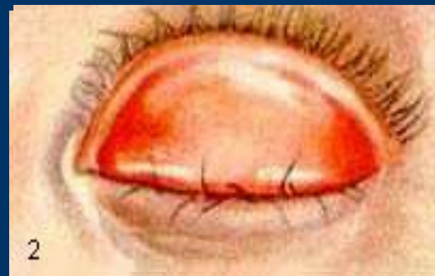
Трахома III стадии с заворотом и трихизом нижнего века.