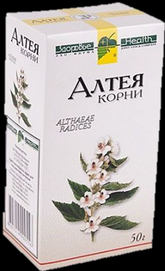
Настой корня алтея