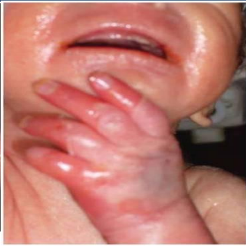
Рис. 3. Синдром стафилококковой ожоженной кожи