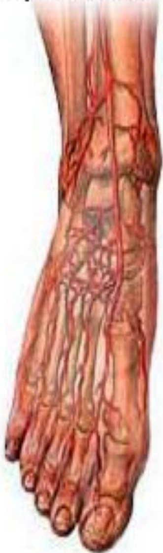
циркуляция крови в здоровой ноге