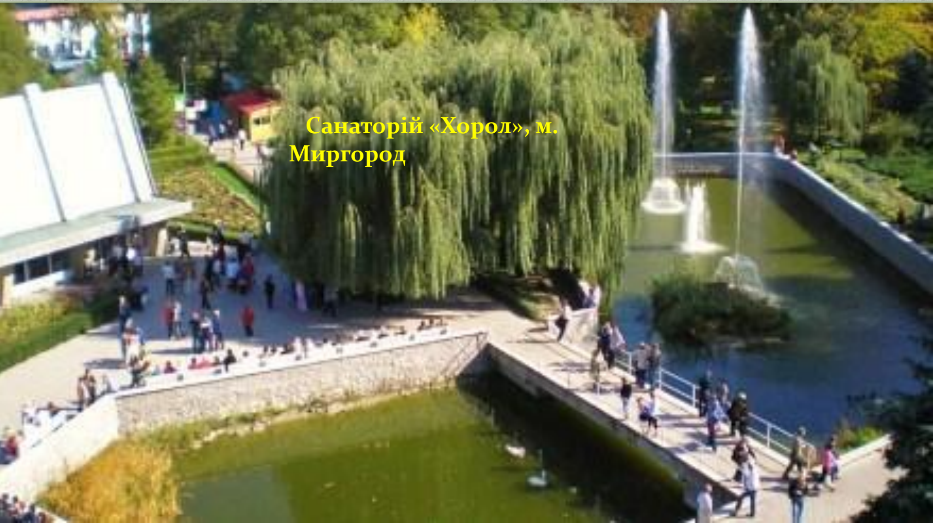
Санаторій «Хорол», м. Миргород

Одноразово санаторій «Хорол» може прийняти на лікування понад 400 осіб. Оздоровниця оснащена сучасним лікувально-діагностичним обладнанням. Щорічно в медичну практику впроваджуються новітні методики лікування. Є власний бювет мінеральної води «Миргородська». Працюють кабінети озокеритолікування, спелеотерапії, пневмопресингу, механотерапії, дуоденального зондування, гастроскопії, УЗД та ін.