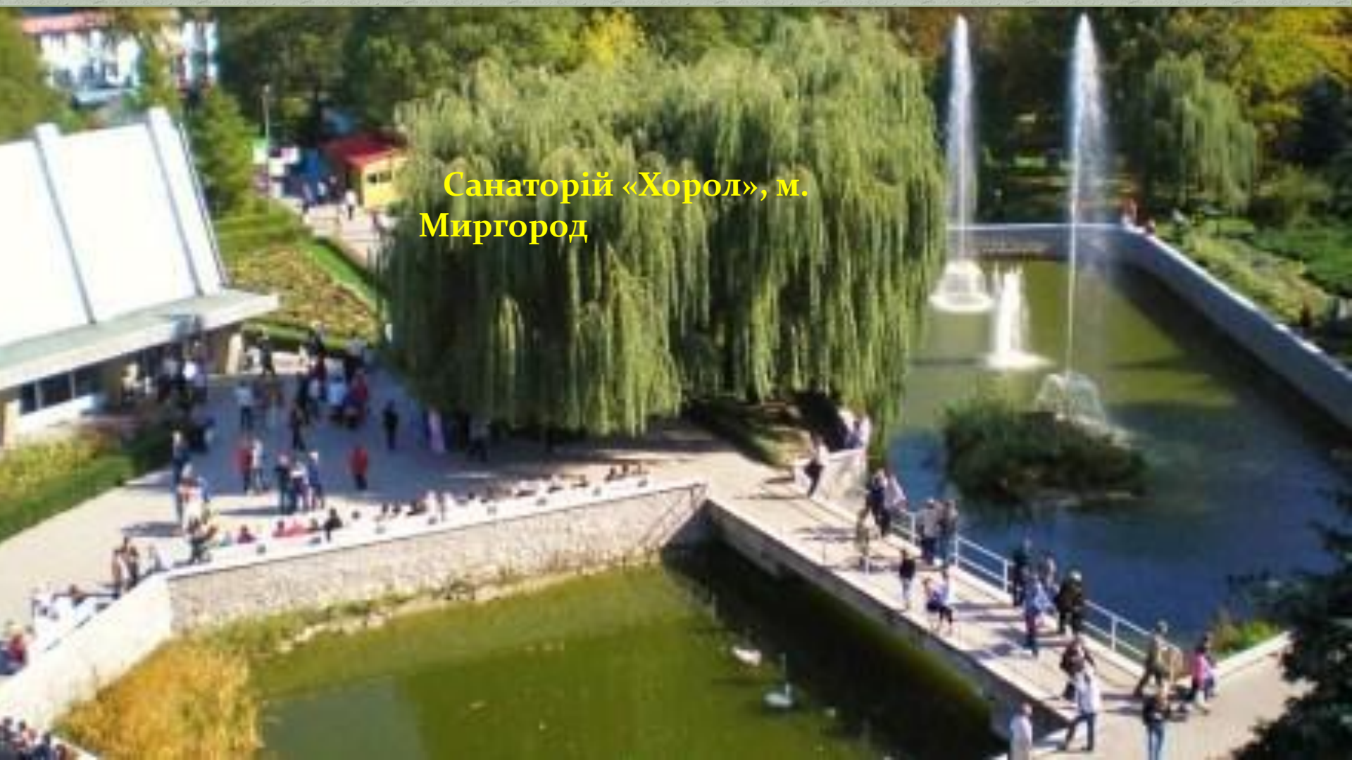
Санаторій «Хорол», м. Миргород

Одноразово санаторій «Хорол» може прийняти на лікування понад 400 осіб. Оздоровниця оснащена сучасним лікувально-діагностичним обладнанням. Щорічно в медичну практику впроваджуються новітні методики лікування. Є власний бювет мінеральної води «Миргородська». Працюють кабінети озокеритолікування, спелеотерапії, пневмопресингу, механотерапії, дуоденального зондування, гастроскопії, УЗД та ін.