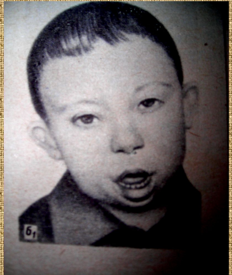
Дети, страдающие болезнью Дауна