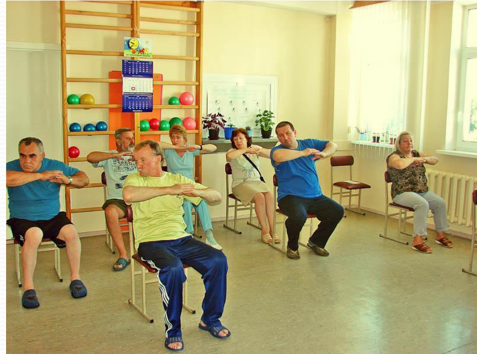
Отделение ранней реабилитации больных, перенесших инфаркт миокарда.

Главным средством предупреждения прогрессирования коронарного атеросклероза и снижения риска повторного инфаркта миокарда остается решительная борьба против факторов риска атеросклероза. После перенесенного инфаркта значение этой борьбы для больного возрастают в десятки раз по сравнению с периодом до инфаркта. Отступить — значит катиться далее по проторенной дороге, навстречу повторному инфаркту. Это должен сразу же глубоко осознать каждый больной.