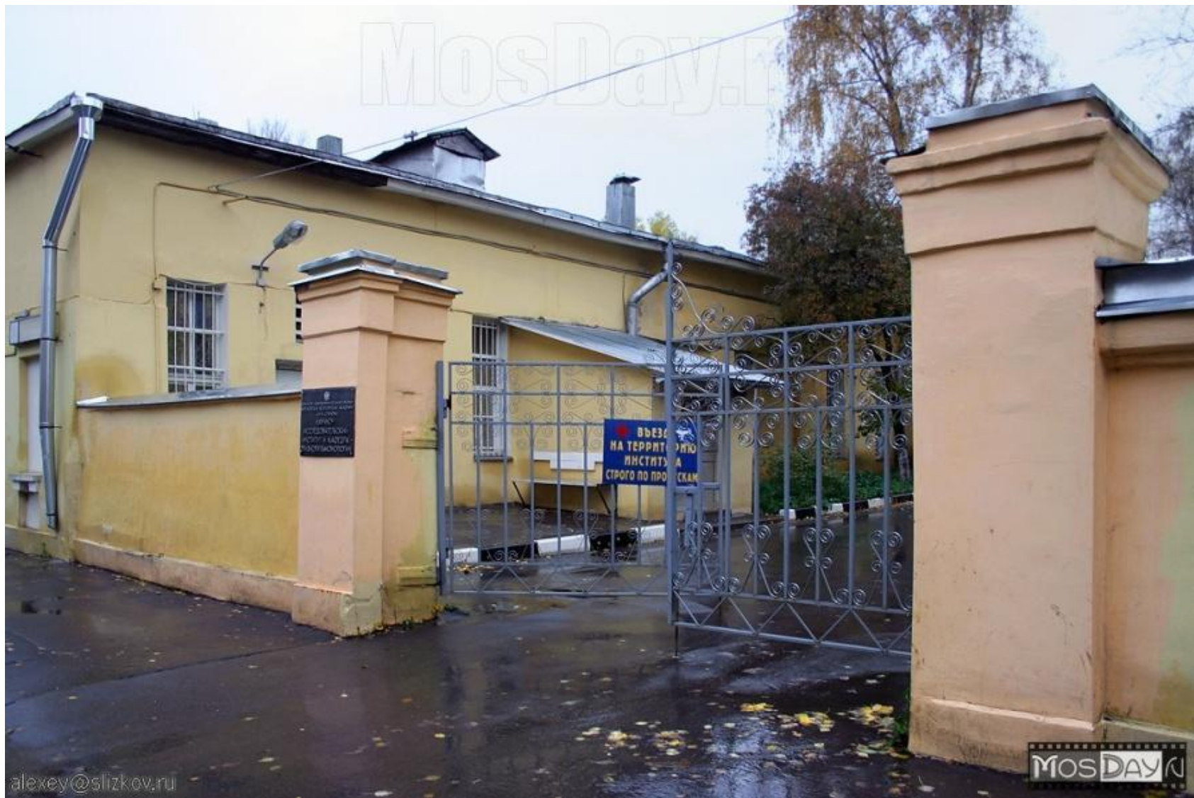
Въезд в институт Фтизиопульмонологии"