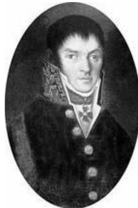
Христофор фон Оппель