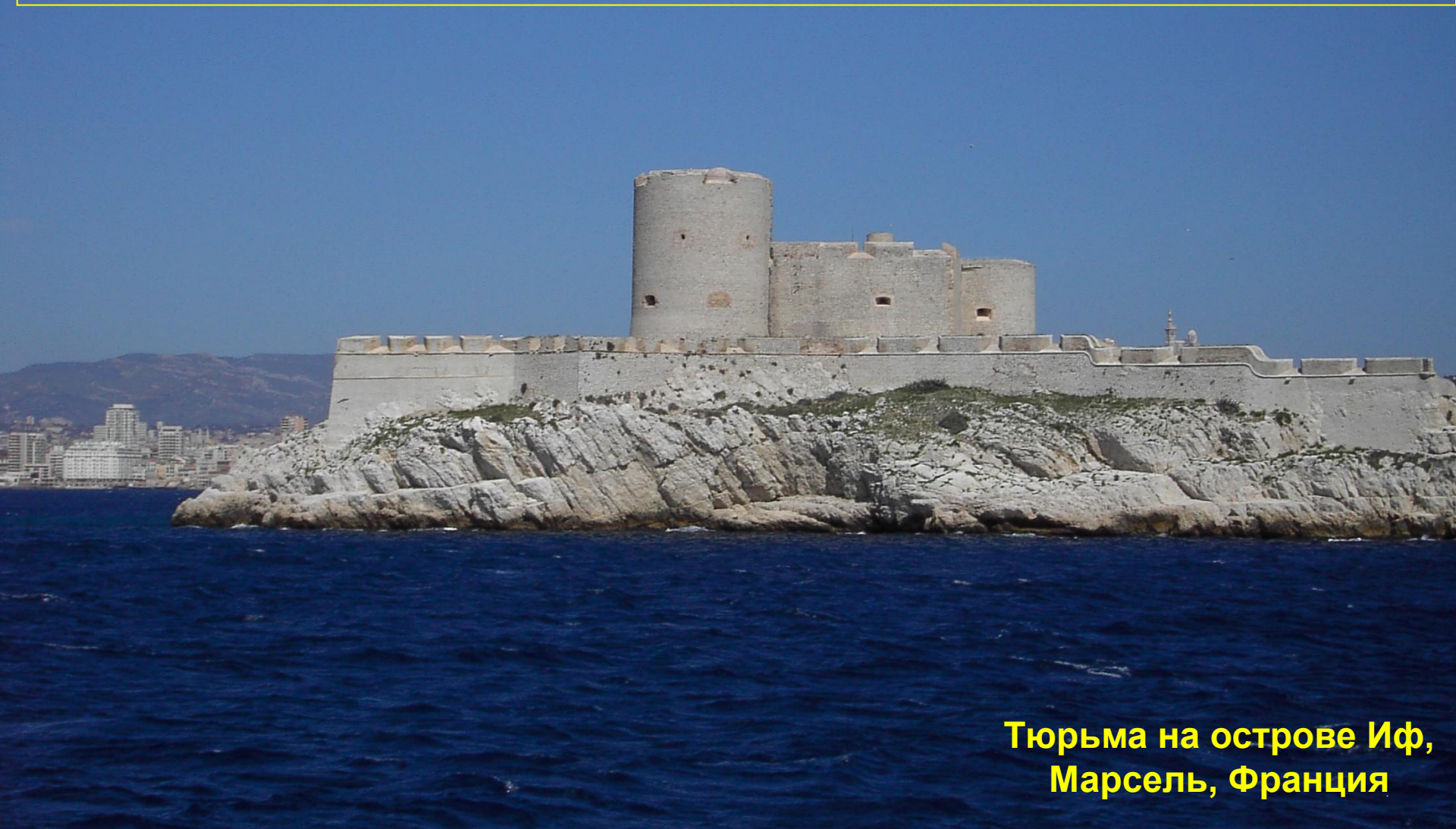
Тюрьма на острове Иф, Марсель, Франция

А.Дюма «Граф Монте-Кристо» (1844-45г.г.)