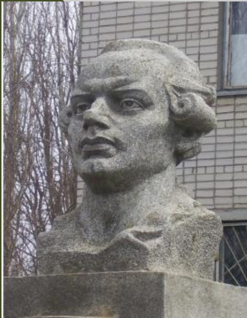
Памятник Даниле Самойловичу, установленный в Николаеве на улице имени Д.Самойловича