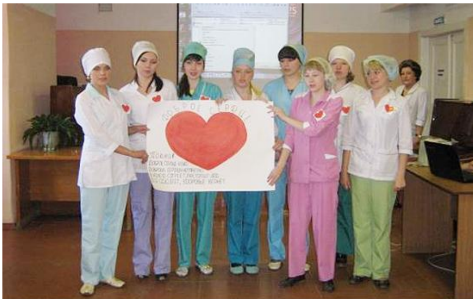
Представление команды «Доброе сердце».