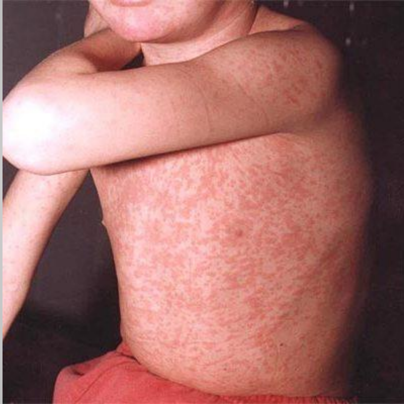
Сыпь при краснухе