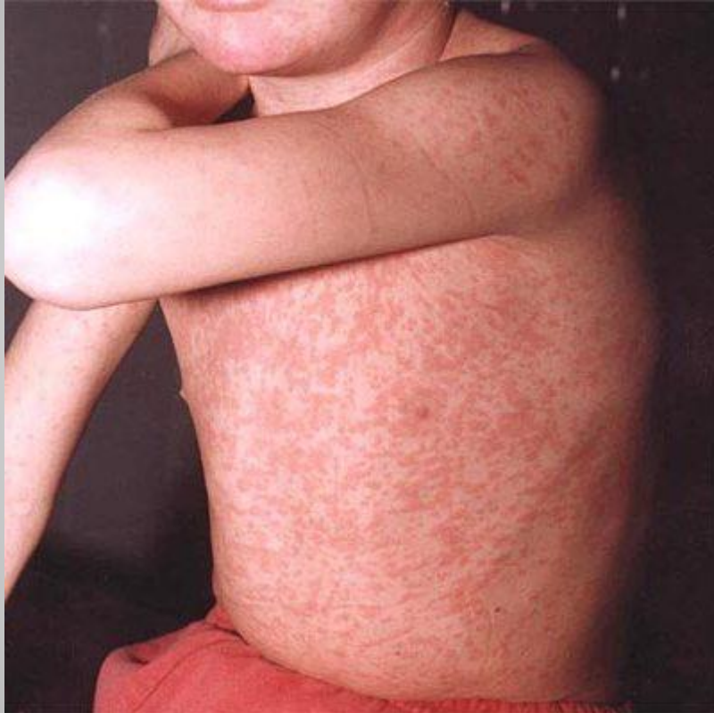
Сыпь при краснухе