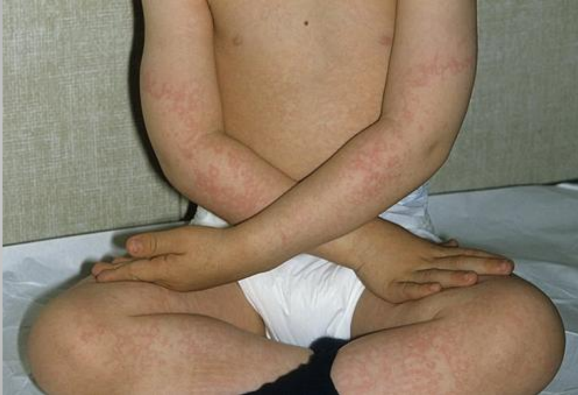
Сыпь при инфекционной эритеме