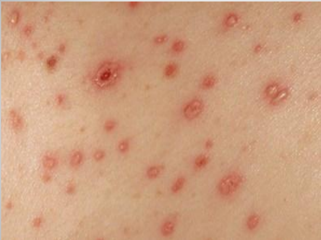
Сыпь при ветряной оспе