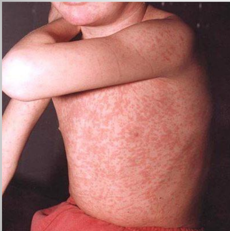
Сыпь при краснухе