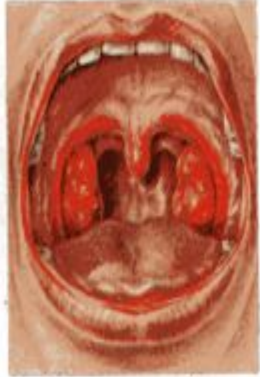
Вид зева в норме, при катаральной ангине и при фолликулярной ангине