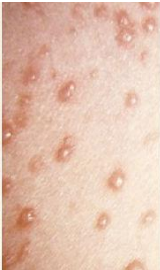
Сыпь при ветрянке