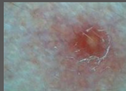
Воспаленная кожа с гиперкератозом