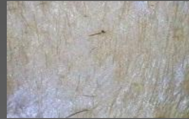
Очень сухая кожа