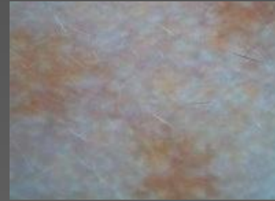
Кожа с пигментными пятнами