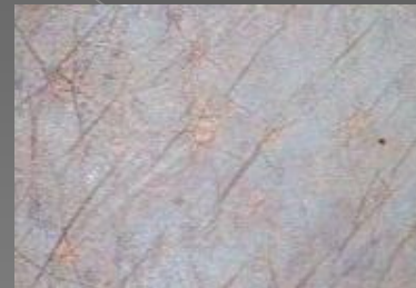
Сухая стареющая кожа