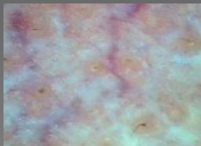
Расширенные капиллярные сосуды