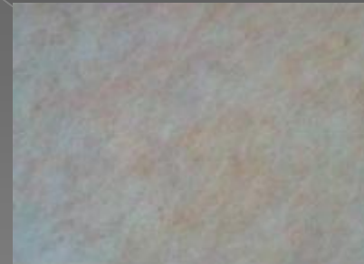
Хорошо ухоженная кожа