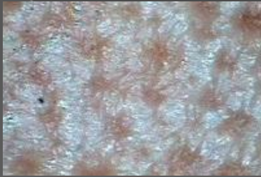
Жирная кожа с очень сильно расширенными порами