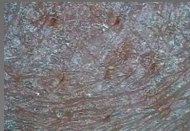
Расширенные поры с кожным салом