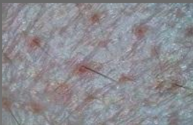
Расширенные поры с акне