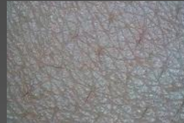
Идеально ухоженная кожа