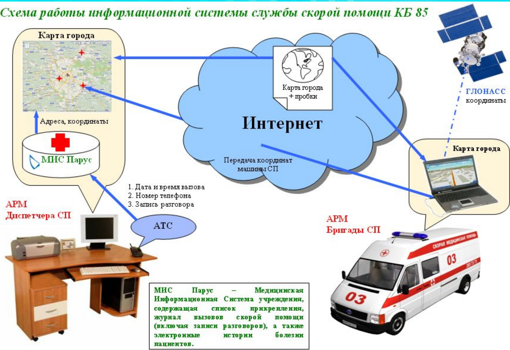
Схема работы информационной системы службы скорой помощи КБ 85