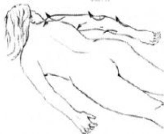
Рис. 16. Массажная операция кругового разминания основанием ладони верхних конечностей.