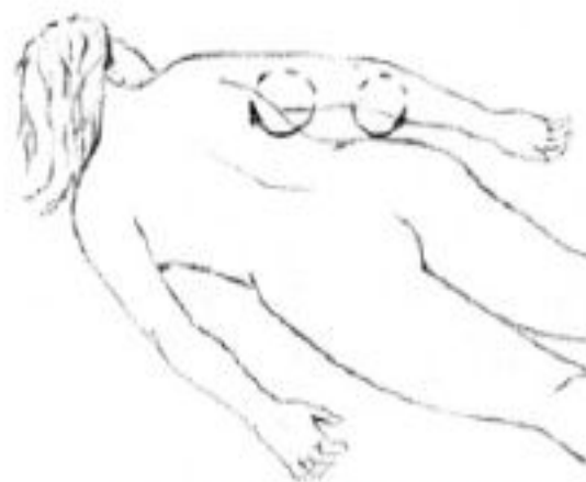
Рис. 17. Массажная операция двойного кольцевого разминания верхних конечностей.