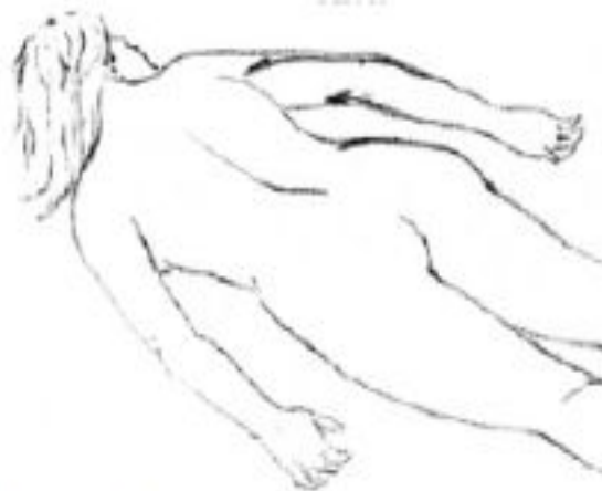
Рис. 14. Массажная операция растирания верхних конечностей.