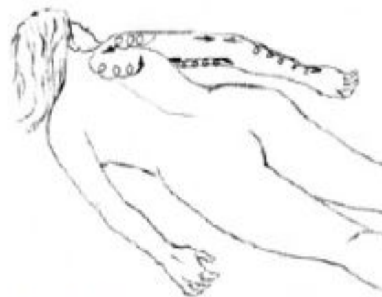
Рис. 15. Массажная операция спиралевидного разминания кончиками пальцев верхних конечностей.