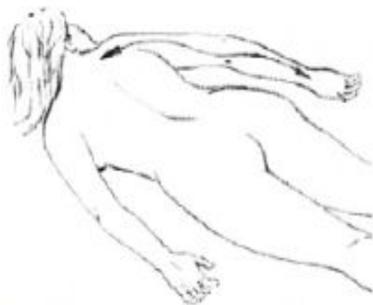
Рис. 13. Массажная операция поглаживания верхних конечностей.