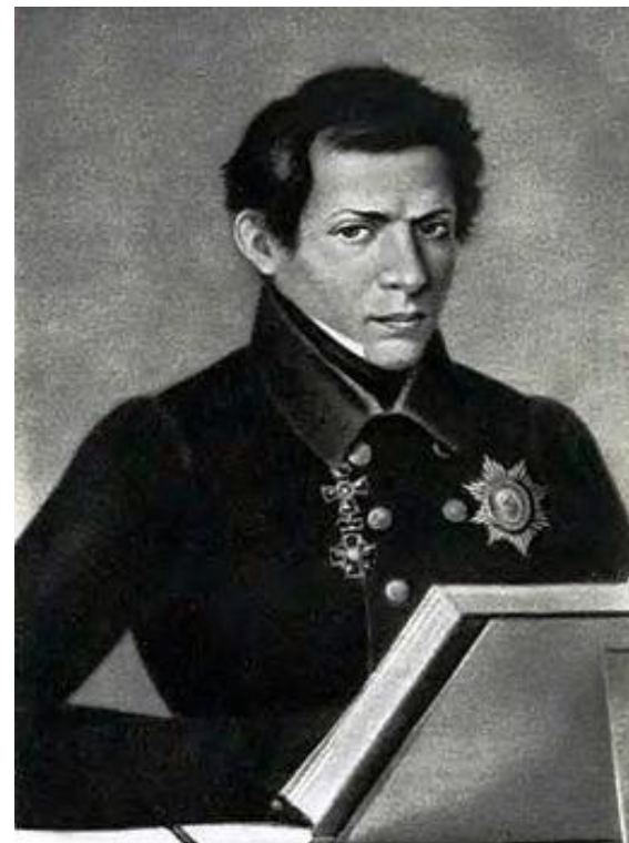
Николай Иванович Лобачевский