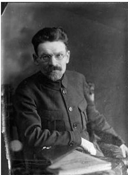
Михаил Иванович Калинин