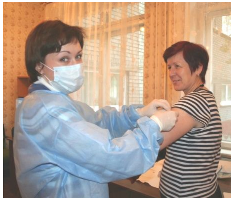
Вакцинация сотрудников гимназии