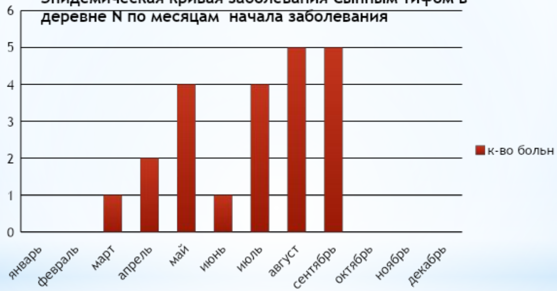
Эпидемическая кривая заболевания Сыпным тифом в деревне N по месяцам начала заболевания