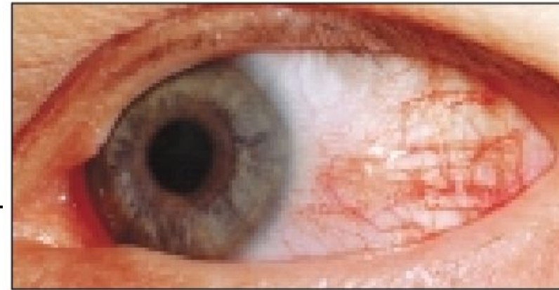
Рис. 27. Узелковый эписклерит у пациентов подагрой