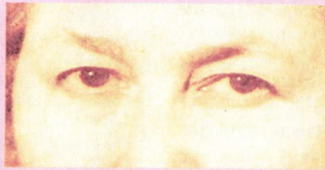
Симптом Хертога (выпадение волос в латеральной части бровей)

Лицо лунообразное одутловатое; кожа сухая, холодная на ощупь, желтушная (признак гиперкаротинемии); выпадение волос на голове, бровях, ломкость ногтей, шелушение кожи (дистрофические изменения); отек не оставляющий ямки при надавливании (накопление связанной воды: перерождение белков чатки с образованием муци-содержащего гиалуроновую лоты, обладающие высокой фильностью → накопление мия; запоры, прогрессиру-брадивалия (сонливость, от-жающим, инертность мыш-лость может доходить до сердца, склонность к бради-роррагии, аменорея; нарас-ниженного аппетита.