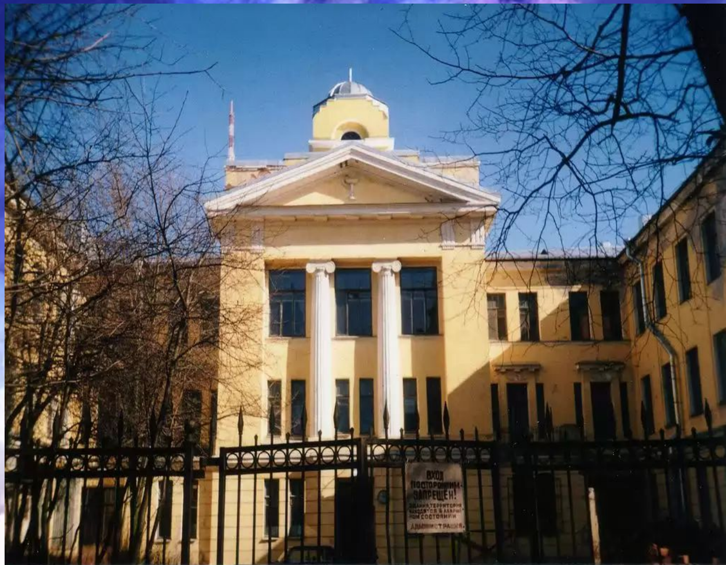
Детская больница им. Филатова Н.Ф.