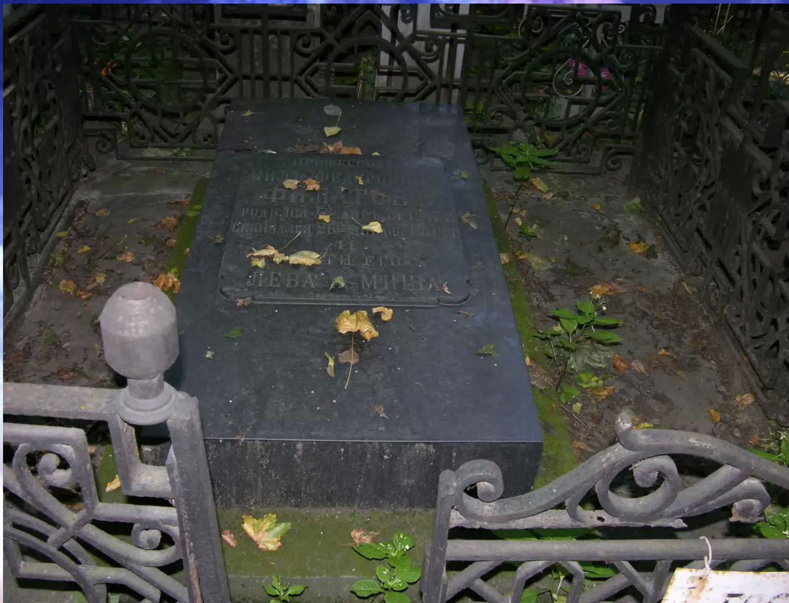
Могила Филатова Нила