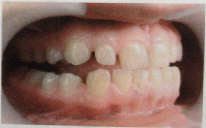
Рис.9.16. Различная величина вертикальной щели слева и справа зубного ряда при выдвигении нижней челюсти.