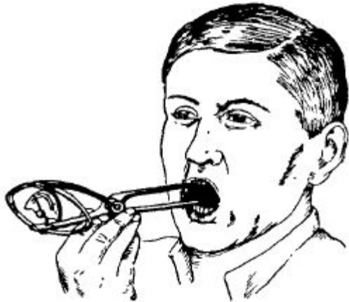
Рис. 47. Гнатодинамометр М. С. Тиссенбаума.