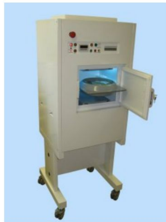
Российский аппарат АРДОК - 1 для стерилизации крови.

Проблему стерилизации и удаление нежелательных агентов из крови, а так же переливания крови иммуносупрессивным лицам и предотвращение реакции типа GVHD можно решить используя рентгеновское излучение. К тому же это избавит нас от необходимости использовать антибиотики и антисептики. Уже существуют специализированные аппараты, причем как Российского, так и заграничного производства. В России обязательным образом облучаются 18 гемотрансфузионных сред, а Европе облучается вся кровь, переливаемая детям.