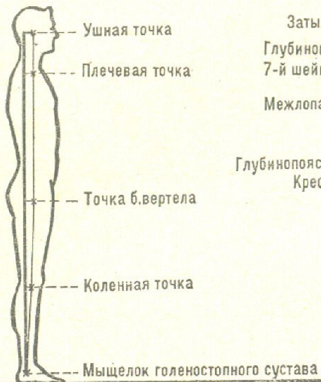
ВЗАИМНОЕ РАСПОЛОЖЕНИЕ ЗВЕНЬЕВ ТЕЛА