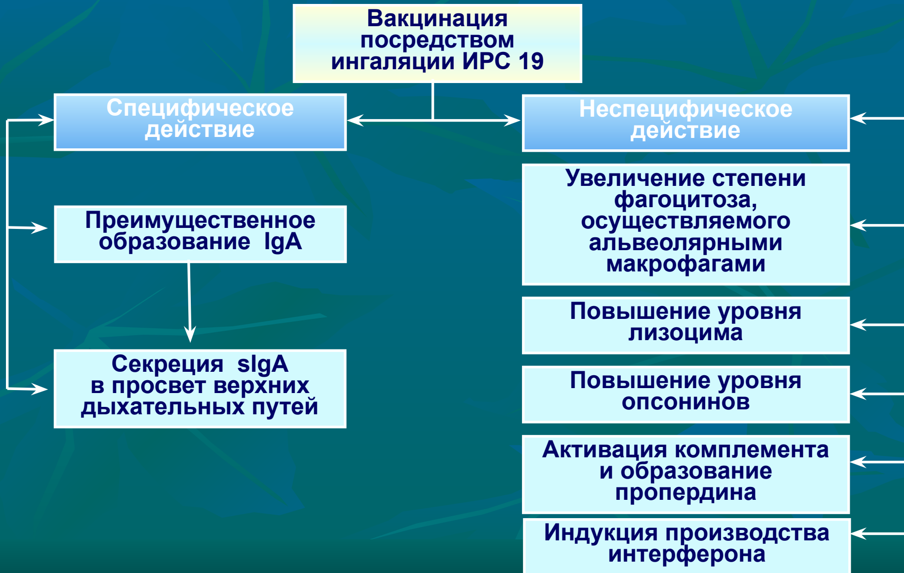
Схема действия местной иммунизации ИРС19