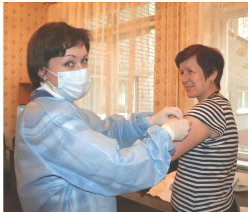
Вакцинация сотрудников гимназии