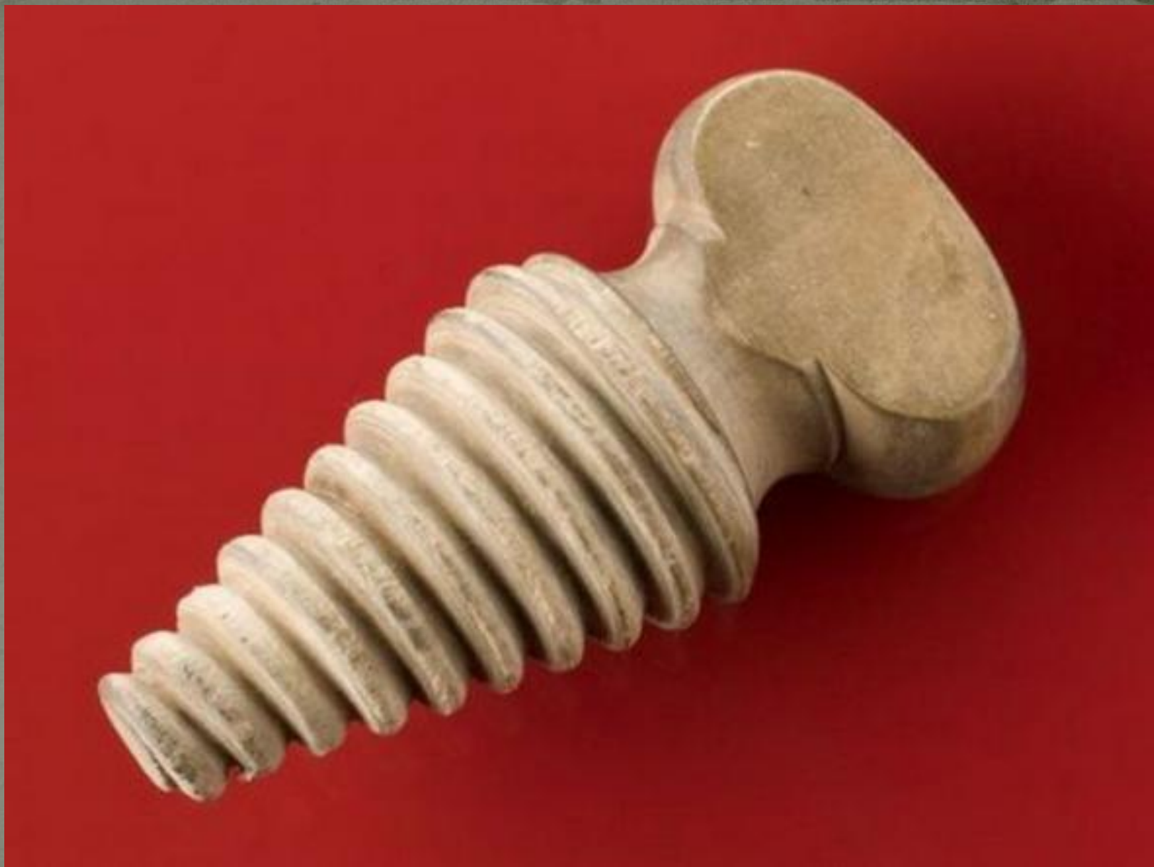
Кляп (19-20 века)