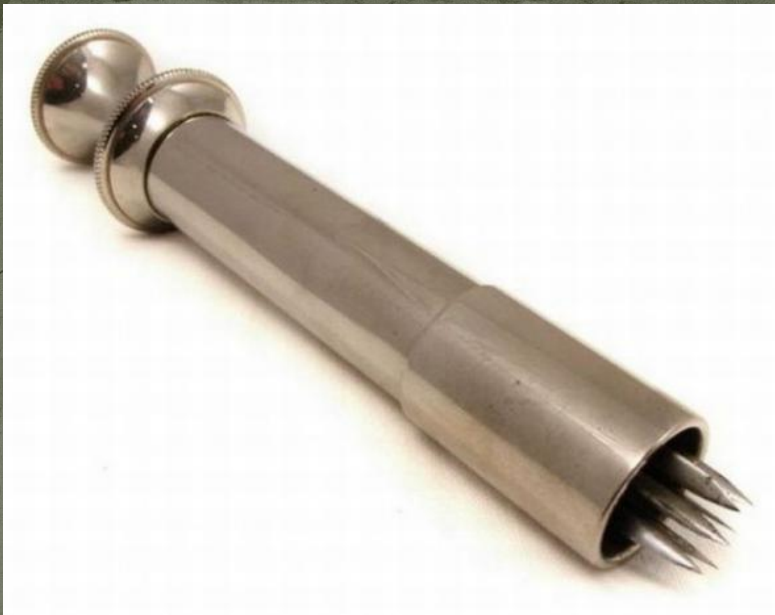
Искусственная пиявка (19 век)