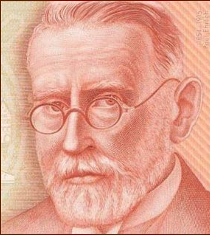
Пауль Эрлих. Портрет на банкноте в 200 марок 1996 г.

Прозорливость Эрлиха поражает, поскольку с некоторыми изменениями эта в целом умозрительная теория подтвердилась в настоящее время.