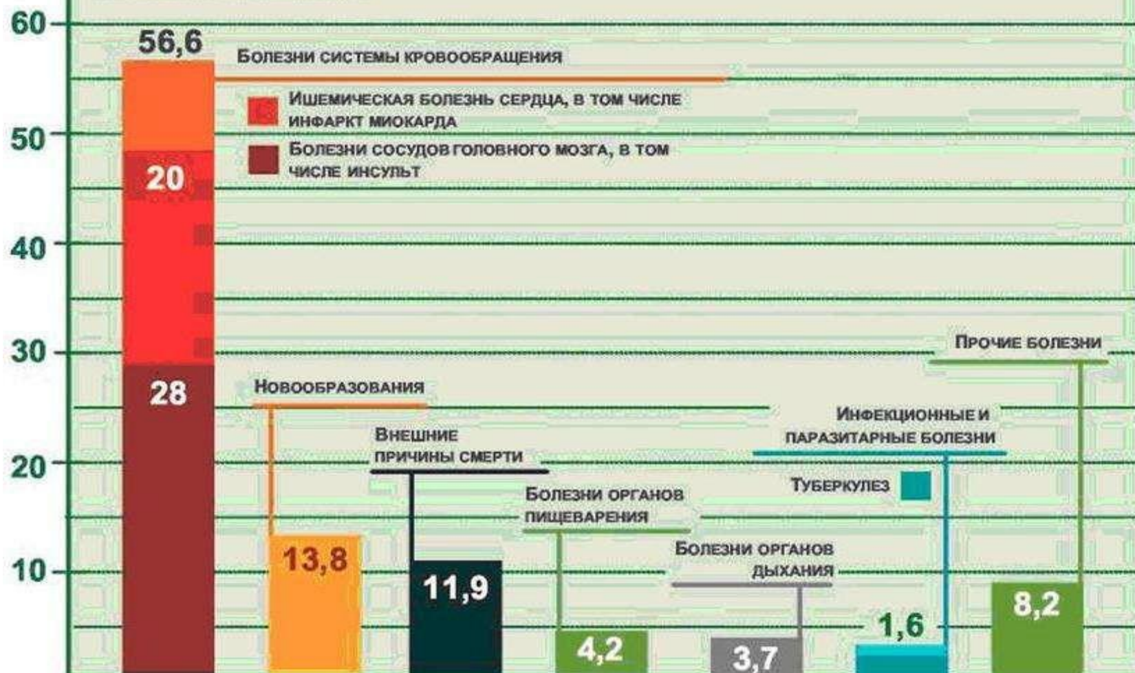
Доля в общей смертности, %