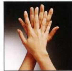
2. Правая ладонь растирающими движениями дезинфицирует тыльную сторону левой кисти.