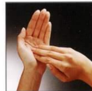
6. Попеременное трение ладоней сжатыми пальцами противоположной ладони.