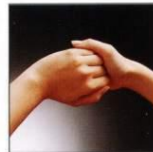
4. Спинки пальцев кисти находятся на противоположной ладони. Пальцы переплетены.