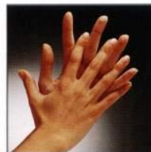
3. Левая ладонь находится на правой кисти. Пальцы рук переплетены.