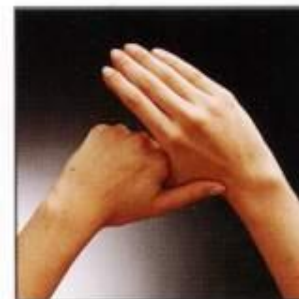
5. Чередующее трение больших пальцев рук противоположными ладонями. Ладони сжаты.