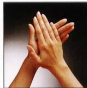
1. Ладонь к ладони.