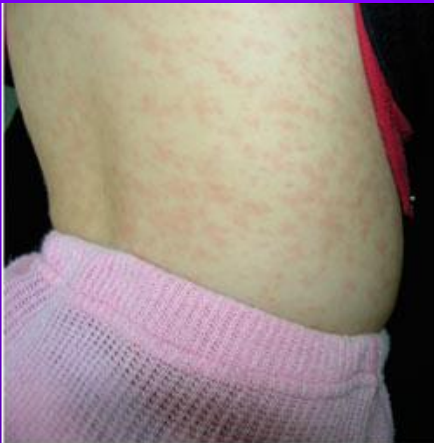
Рисунок 1. Пациентка М., 4 года. Корь, второй день высыпания