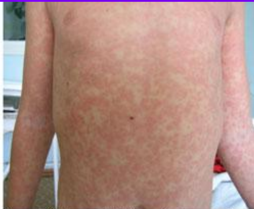
Рисунок 2. Пациент М., 11 лет. Инфекционный мононуклеоз, токсико-аллергический дерматит