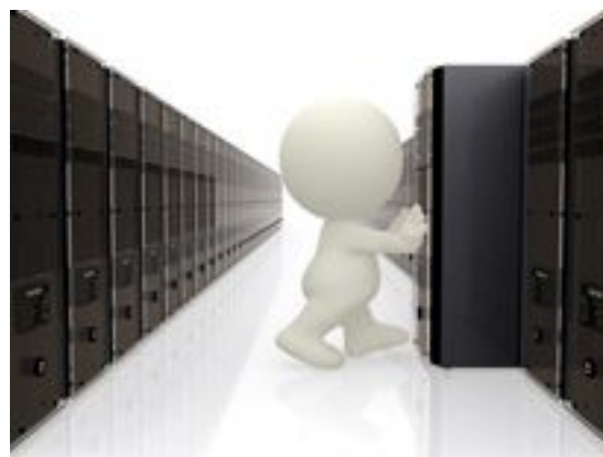
Hitachi Clinical Repository