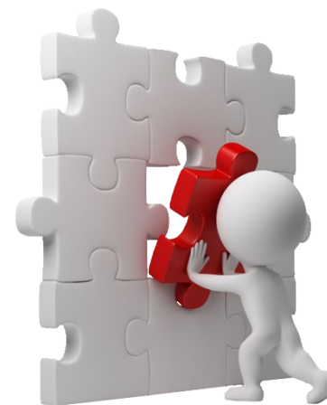
Интеграция RIS, LIS, Back Office