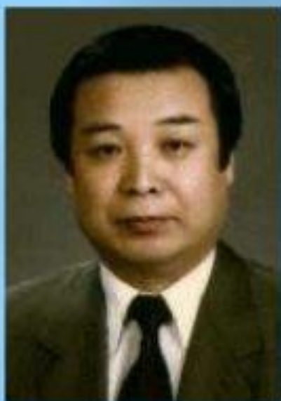
Разработал это направление корейский профессор Пак Чжэ Ву

Метод терапии су-джок основан на том, что каждому органу человеческого тела соответствуют биоактивные точки, расположенные на кистях и стопах. Воздействуя на эти точки, можно избавиться от многих болезней или предотвратить их развитие. Су-джок - это метод, проверенный исследованиями и доказавший свою эффективность и безопасность. Эта система настолько проста и доступна, что освоить ее может даже ребенок. Метод достаточно один раз понять, затем им можно пользоваться всю жизнь.