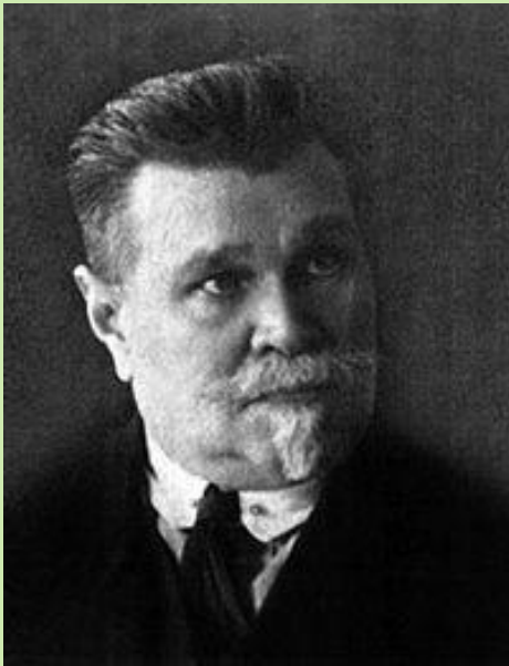
Семён Семёнович Зимницкий

Один из видов исследования мочи, применяемый для определения водовыделительной, концентрационной способности почек и функции разведения. Предложена С. С. Зимницким.